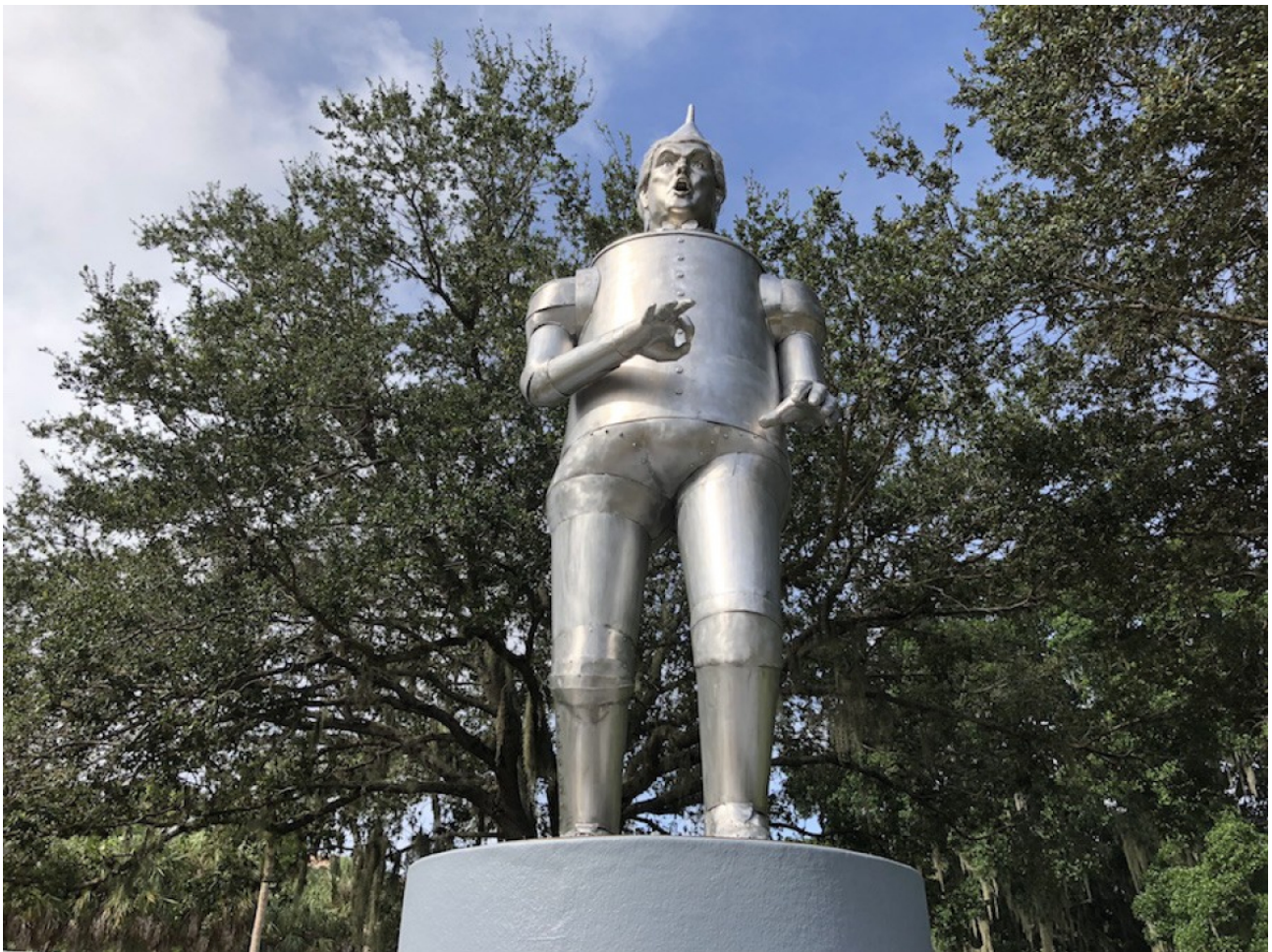
'Tin Man of the Twenty-First Century', 2018, de Coco Fusco.